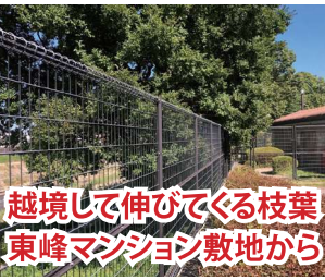
越境して伸びてくる枝葉 東峰マンション敷地から