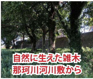
自然に生えた雑木 那珂川河川敷から