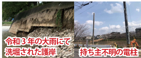
令和3年の大雨にて洗堀された護岸