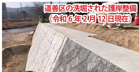
道善区の洗堀された護岸整備 (令和6年2月12日現在)

現在は、令和5年の大雨にて、令和3年に根が露出した場所の下流側が洗堀され、県が工事を行っています。