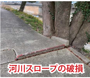
河川スロープの破損