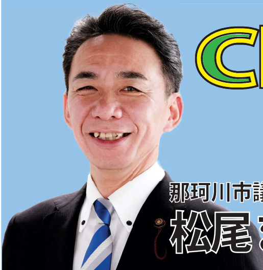
那珂川市議会議員